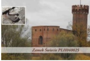
Zamek Świecie PL11040025