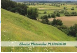
Złociszewo Plateau PL11040040