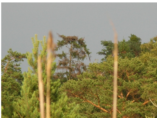
Fot. platforma lęgowa rybołowa w Nadleśnictwie Międzyrzecz

Aby ochronić ostatnie rybołowy na terenie województwa lubuskiego, Regionalna Dyrekcja Ochrony Środowiska w Gorzowie Wielkopolskim podjęła działanie polegające na opracowaniu regionalnej strategii ochrony populacji rybołowa na terenie województwa lubuskiego. Do niewrażliwych założeń opracowywanego dokumentu, należy m.in. praktyczne wdrożenie działań i środków mających na celu skuteczne powstrzymanie procesu zaniku tego gatunku oraz odbudowę stanu jego populacji w regionie Ziemi Lubuskiej. Jednym z podstawowych działań ochrony czynnej, wpisującej się m.in. w ramy lubuskiej strategii ochrony rybołowa, jest programowa i długo falowa działalność polegająca na budowie sztucznych platform gniazdowych. Działanie to, jest najbardziej rozpowszechnioną i skuteczną formą czynnego wspierania populacji dzikich gatunków ptaków o wysokich wymaganiach siedliskowych i konserwatywnych ekologicznie.