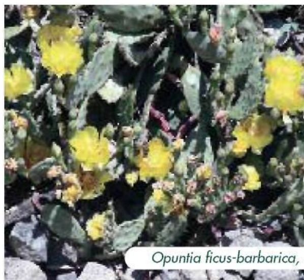
Opuntia ficus-barbarica ,

Zestaw kodeksów St Louis opracowano na podstawie spotkania przedstawicieli branży szkółek ogrodniczych, ogrodów botanicznych, architektów krajobrazu, organów ds. ogrodnictwa w St Louis w amerykańskim stanie Missouri w roku 2001. Kodeksy powstały jako dobrowolne wytyczne lub najlepsze praktyki zarządzania w celu zapobiegania wprowadzaniu i rozprzestrzenianiu się roślin inwazyjnych. W Załączniku nr 4 znajduje się kopia kodeksu dla ogrodów botanicznych.