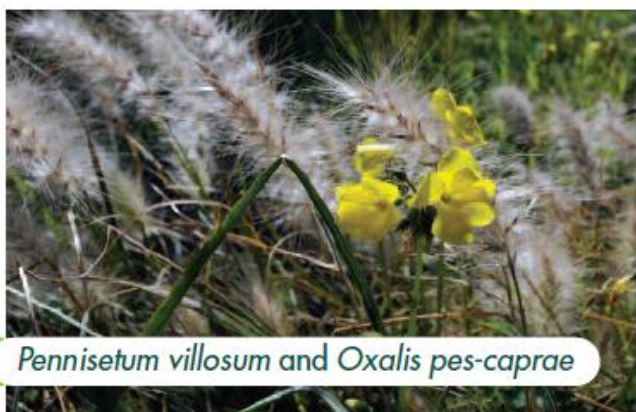
Pennisetum villosum and Oxalis pes-caprae

Powszechnie przyjmuje się, że w przeciągu najbliższych 50-100 lat globalna zmiana klimatu przyniesie szereg skutków w obszarze środowiska naturalnego i dystrybucji gatunków. Jej konsekwencje, jak np. rosnące poziomy dwutlenku węgla i temperatura, wraz ze zmianą wykorzystania gruntów, wzrostem populacji i ruchami ludności, mogą szczególnie oddziaływać zarówno pozytywnie, jak i negatywnie na wzrost roślin i ryzyka inwazji (Bradley i in., 2010). Choć związek zmiany klimatu z bioróżnorodnością jest wciąż w stadium początkowym, a dokładne prognozy w odpowiedniej skali, szczególnie w zakresie konkretnych reakcji gatunków dziko rosnących, okazały się trudne (Parmesan i in., 2011), mamy już dość dowodów na oddziaływanie ostatnich zmian w obszarze występowania gatunków i ekosystemów, które można przypisać skutkom zmiany klimatu. Gatunki powszechnie reagują na zmianę klimatu poprzez zmiany cech fenologicznych, jak np. zmiany czasu wypuszczania pąków, kwitnienia, owocowania, ubarwienia liści i ich opadania (Cleland i in., 2007). W celu zapoznania się z wpływem zmiany klimatu na bioróżnorodność, warto zajrzeć do publikacji Rady Europy (2010), na europejskie i śródziemnomorskie gatunki roślin – z pracą Heywooda (2009, 2011b, 2012), a z globalną analizą roślin i zmiany klimatu przeprowadzoną przez BGCI – z pracą Hawkinsa i in. (2008).